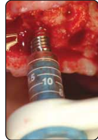
La pinza dinamometrica agevola l'avvitamento dell'Oswill e controlla lo stress compressivo dell'osso The torque spanner facilitates the screwing of the Oswill and controls the bone compressive stresses