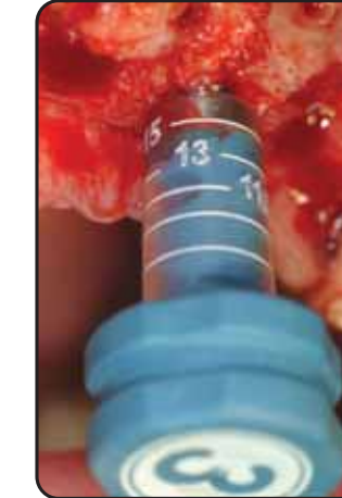
La sonda consente il controllo della profondità di osteotomia The probe allows for an osteotomy depth control