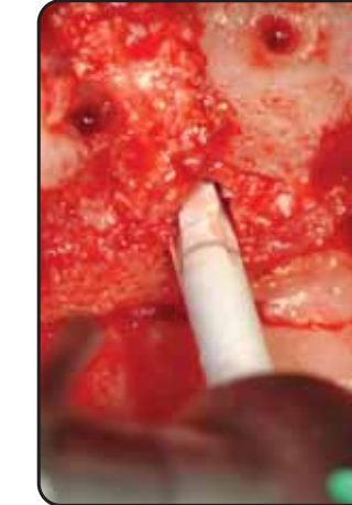
Preparazione del foro guida con fresa Ø 2.5 mm Preparation of the pilot hole with Ø 2.5 mm drill