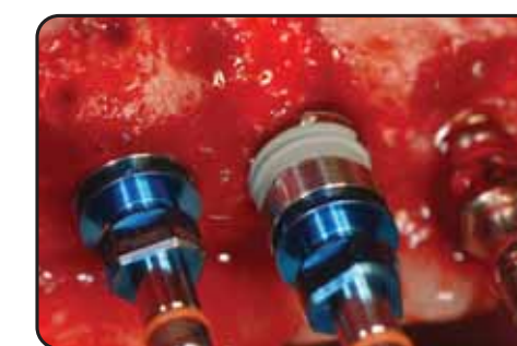
Gli impianti in sito The implants in site