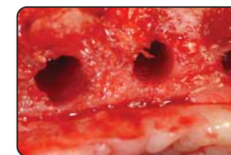
I siti trattati con Oswill prima del posizionamento implantare Oswill treated sites before implant insertion