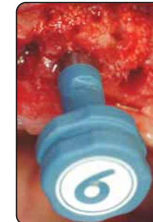
Osteotomia finale con Oswill Oswill final osteotomy