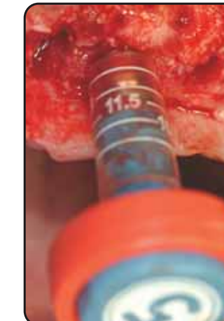
La pinza rossa garantisce una maggior forza di avvitamento The red torque spanner ensures greater screwing strength